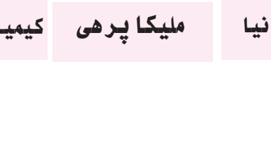
کیمیا مینابی نژاد