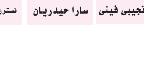
همان نجیبی فینی